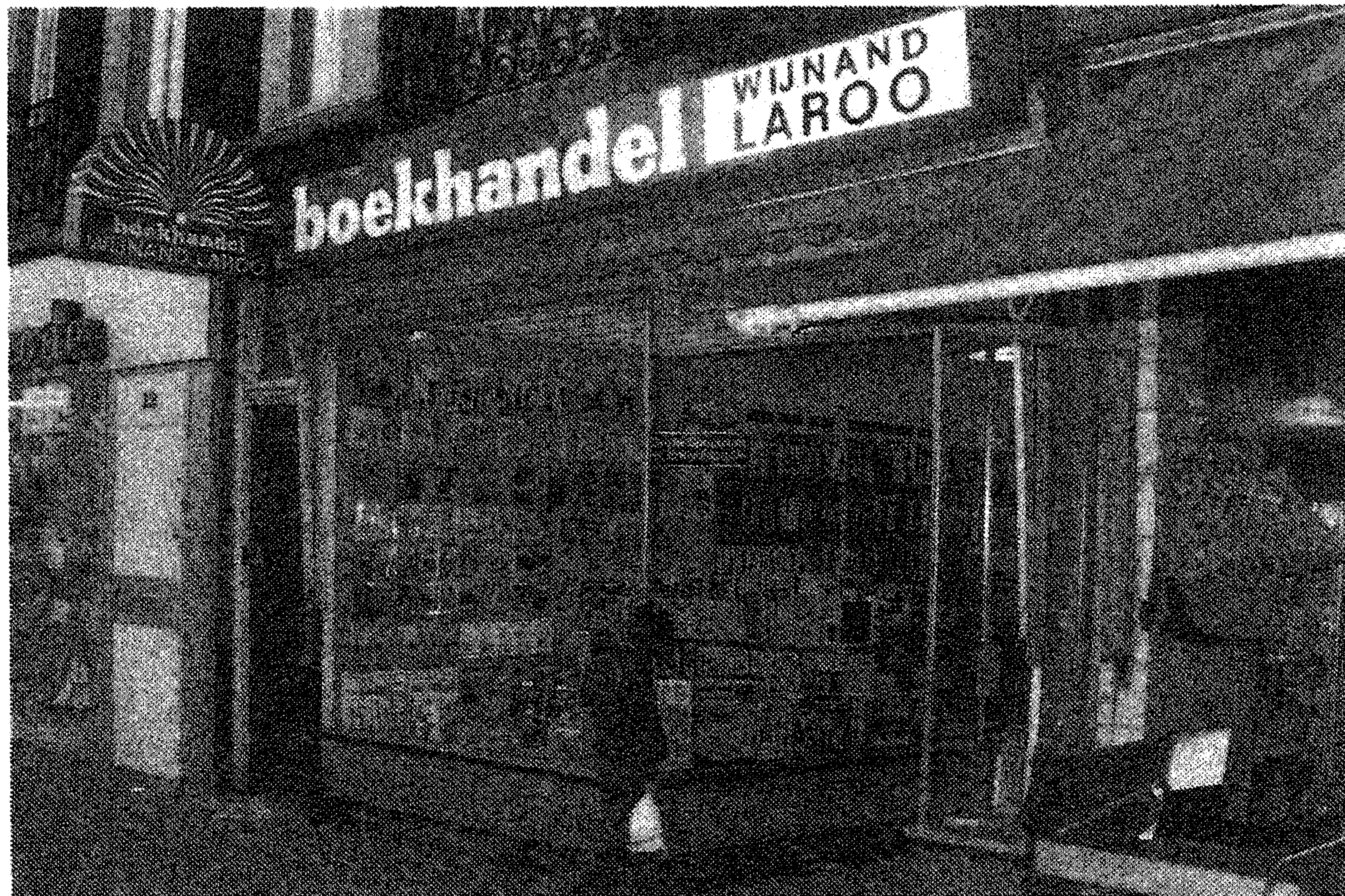
De boekhandel bestaat gelukkig nog.

gingen moeilijk langs de officiële weg en die bestelden wij gewoon bij die boekwinkel. Nou was de grote ramp dat de eigenaar van het boekwinkeltje niet door had, wat er aan de hand was. Wij waren toen allebei nog piepjong en hij dacht: 'dat zijn studenten, en als die een boek bestellen dan komt er volgende week weer een student. Ik bestel er drie of vier exemplaren van, dan heb ik ze vast in voorraad'.